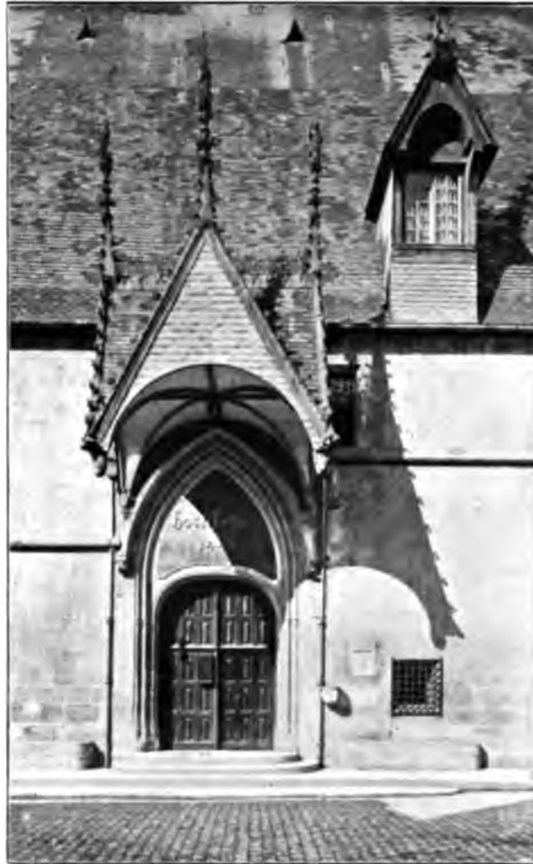
Ch. de Neudon.

lisent sur plusieurs tableaux. L'image du donateur se voit deux fois. Reprises avec discrétion et soigneusement entretenues, ces tapisseries sont encadrées d'architectures dans le style Louis XII.